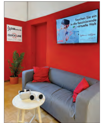
Im neuen Virtuality-Corner in faszinierende virtuelle Welten eintauchen.

Wir möchten der GA Buchsi AG herzlich für ihr grossartiges Sponsoring und die hervorragende Zusammenarbeit danken, die es uns ermöglicht hat, diesen Virtuality-Corner einzurichten. Besuchen Sie uns in der Bibliothek Herzogenbuchsee und lassen Sie sich von unserer neu gestalteten Sitzecke begeistern! (boa)